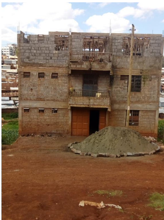
Building in Progress